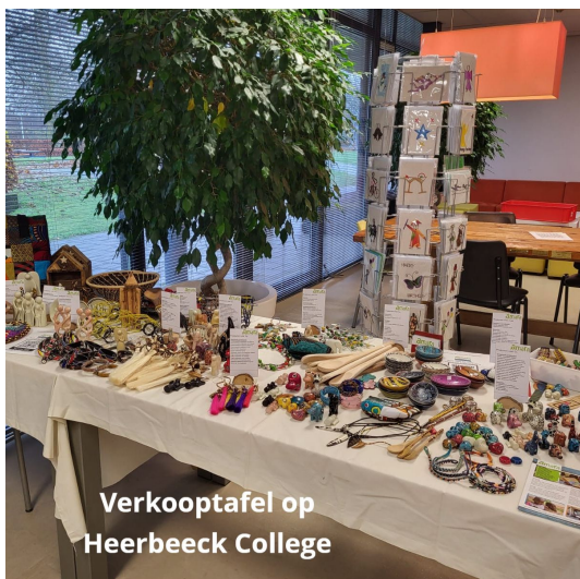
Verkooptafel op Heerbeek College