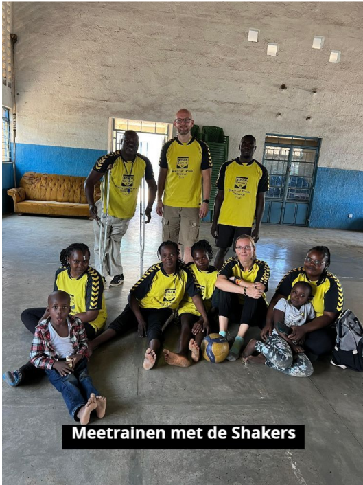
Meetrainen met de Shakers