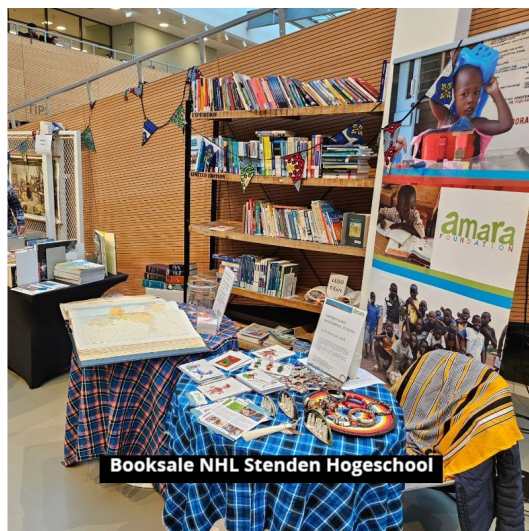
Booksale NHL Stenden Hogeschool