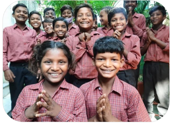
Kinderen van de Little Stars School