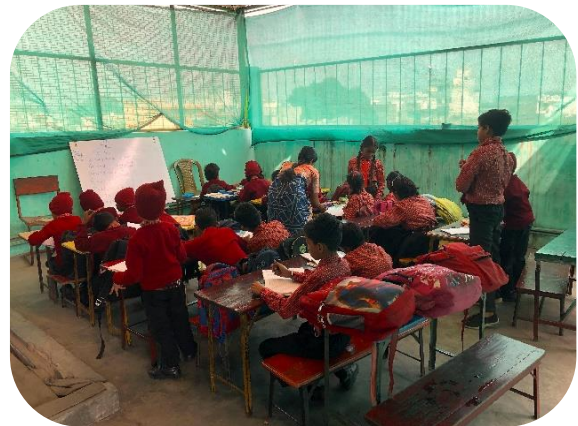
In de klas