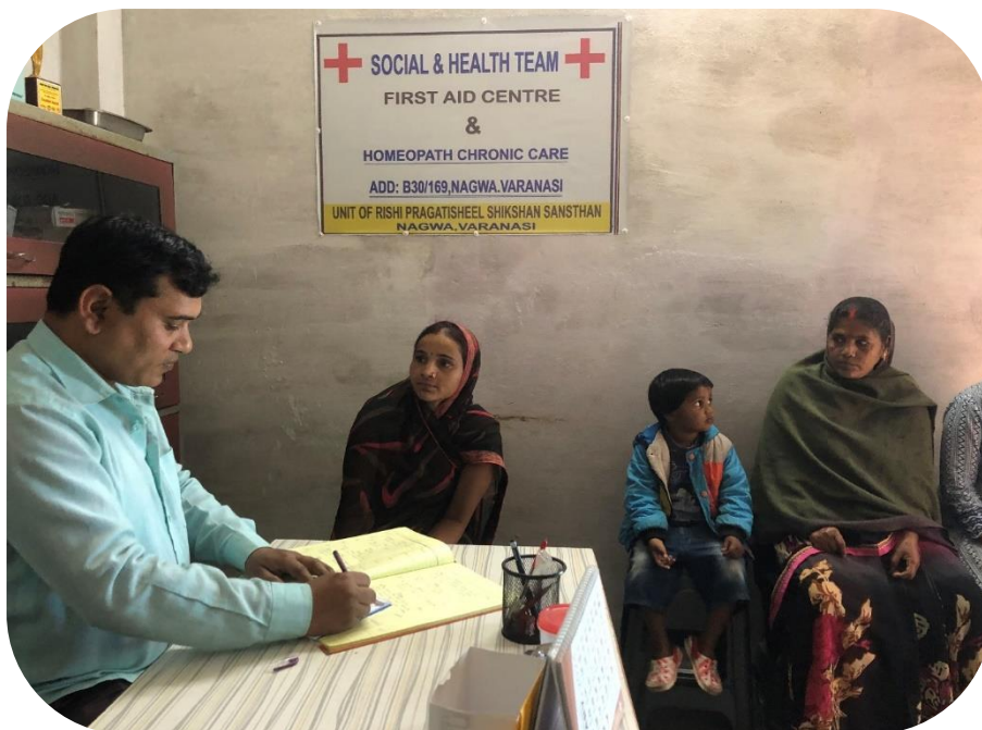
De homeopaat met een patiënt