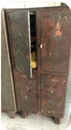
De oude kast werd met vieren gedeeld

Er werd afgestemd om de samenwerking zo goed mogelijk te laten verlopen. We evalueerden het afgelopen jaar. Alle betrokkenen zijn over het algemeen tevreden. Reguliere verslaglegging en communicatie blijven punten van aandacht. Wij als Stichting Benaresfonds zijn blij dat we onder de paraplu van de school en hun FCRA kunnen werken waardoor onze geldstroom legaal en gewaarborgd is. Omdat de school samenwerkt met het Vision Varanasi Eye Hospital kunnen de mensen uit Nagwa hier ook gebruik van maken. Vanuit deze kliniek worden er Eye Camps in de wijk georganiseerd. Voor veel mensen uit de wijk en leerlingen van de LSS, kunnen we nog altijd het verschil maken tussen overgelaten worden met weinig kansen, of gezien en geholpen worden. Met uw hulp als donateur, diverse stichtingen en organisaties die ons steunen, hopen we dit belangrijke werk, nog lang als nodig, voort te kunnen zetten. We willen u hiervoor hartelijk bedanken.