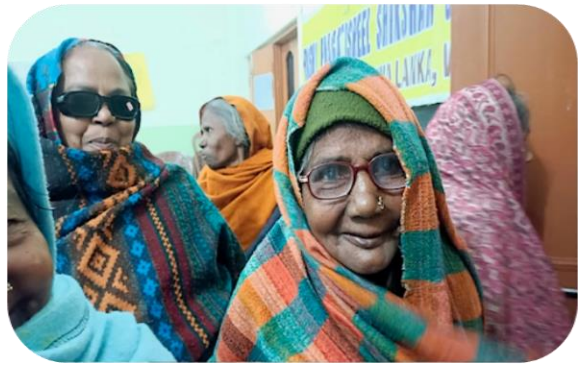
Bijeenkomst voor vrouwen