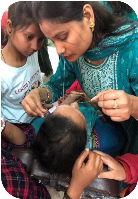
Oefenen tijdens de beautician-course