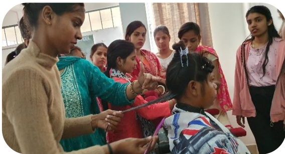
De beautician course