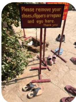
Bord bij de Ashram